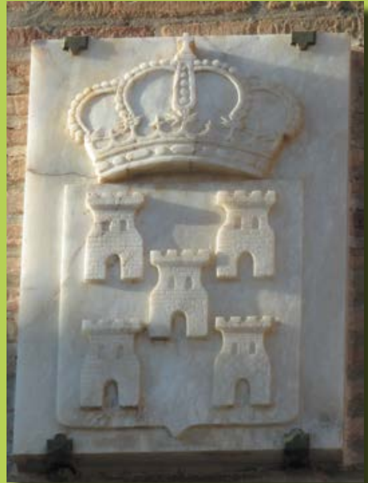
Escudo de Fuentes de Ebro en alabastro. Fachada del Ayuntamiento.