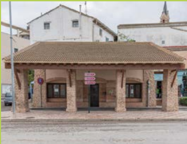
Estación de autobuses de Fuentes de Ebro

Puedes llegar hasta nuestro municipio por diferentes medios de transporte: autobús, tren, coche, bici...incluso los hay tan aventureros que llegan a pie.