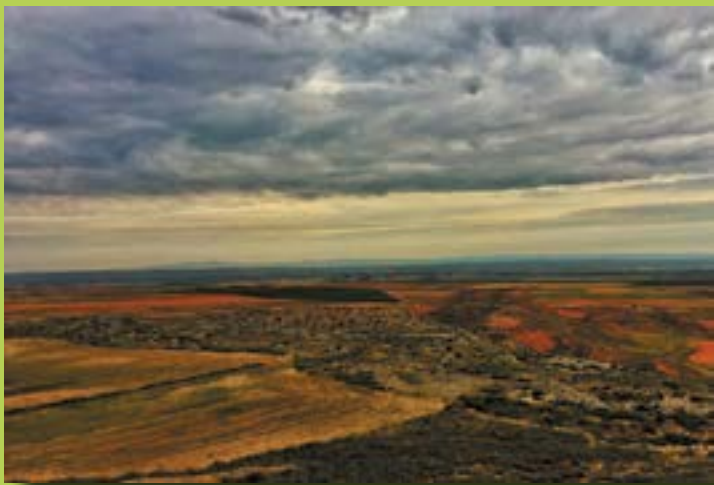
Vista panorámica desde el Monte Pufarrando

Desde allí puedes contemplar la huerta de Fuentes y los regadíos de los pueblos cercanos.