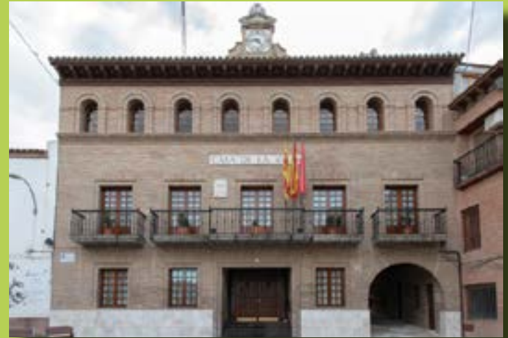
Ayuntamiento de Fuentes de Ebro

¿De qué material crees que están contruidos?