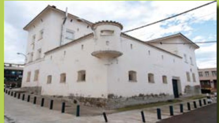
Antiguo cuartel de la Guardia Civil.

Explorador , recorre el pueblo y reconoce las 2 fases de Casas de Regiones Devastadas.