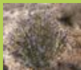
Coronilla de fraile